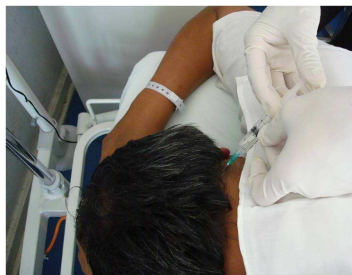
Figura 3: Zona de infiltración occipital.