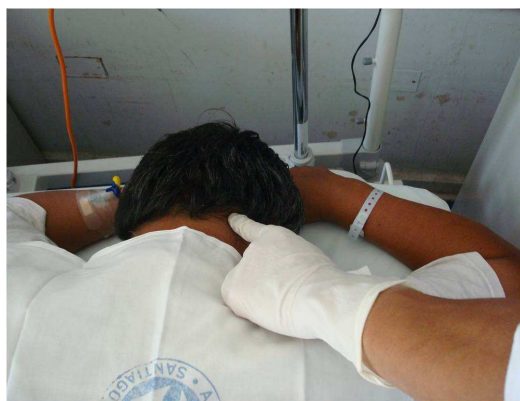
Figura 2: Ubicación zona gatillo occipital.